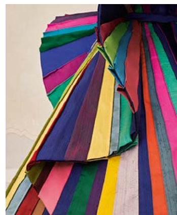
(上) プリーツ加工のシルクタフタのドレス (1985年制作)。 (下、左から右へ) 起業家、ジョヴァンニ・パツチスタ・ジョルジーニ創設のイタリア・ハイファッション・ショーの50周年記念「ジョルジーニへのオマージュ (Omaggio a Giorgini)」(2001年制作)／見る角度によって色が変化するドレスのスカート(1992年制作)。光沢のあるシルクタフタ製「線 (Linee)」(2007年制作)。ヘリンボーン柄に重ねた色彩豊かなシルクタフタのなかでもピンクの色みが際立っている。