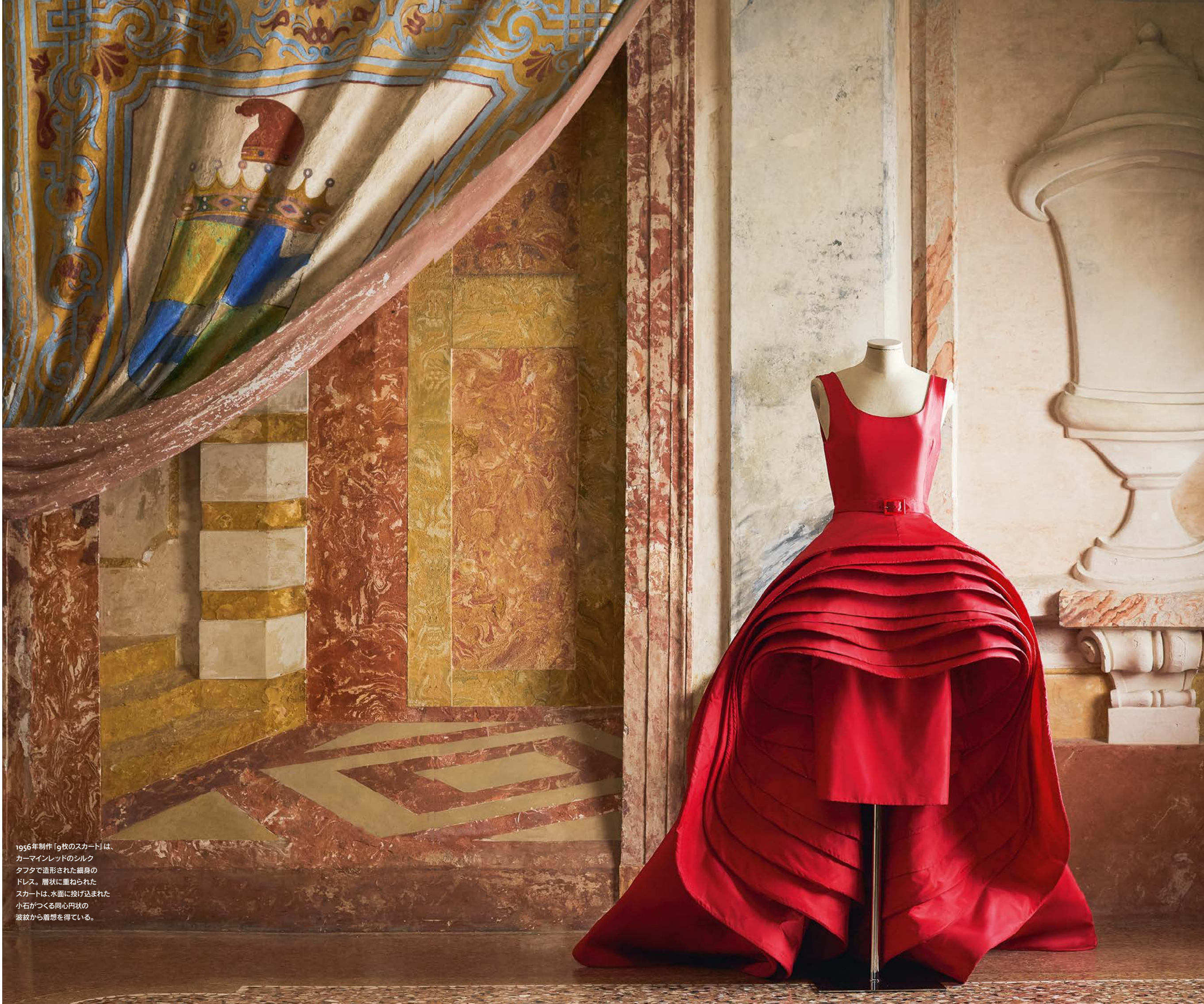
1956年制作「9枚のスカート」は、カーマインレッドのシルクタフタで造形された細身のドレス。層状に重ねられたスカートは、水面に投げ込まれた小石がつくる同心円状の波紋から着想を得ている。