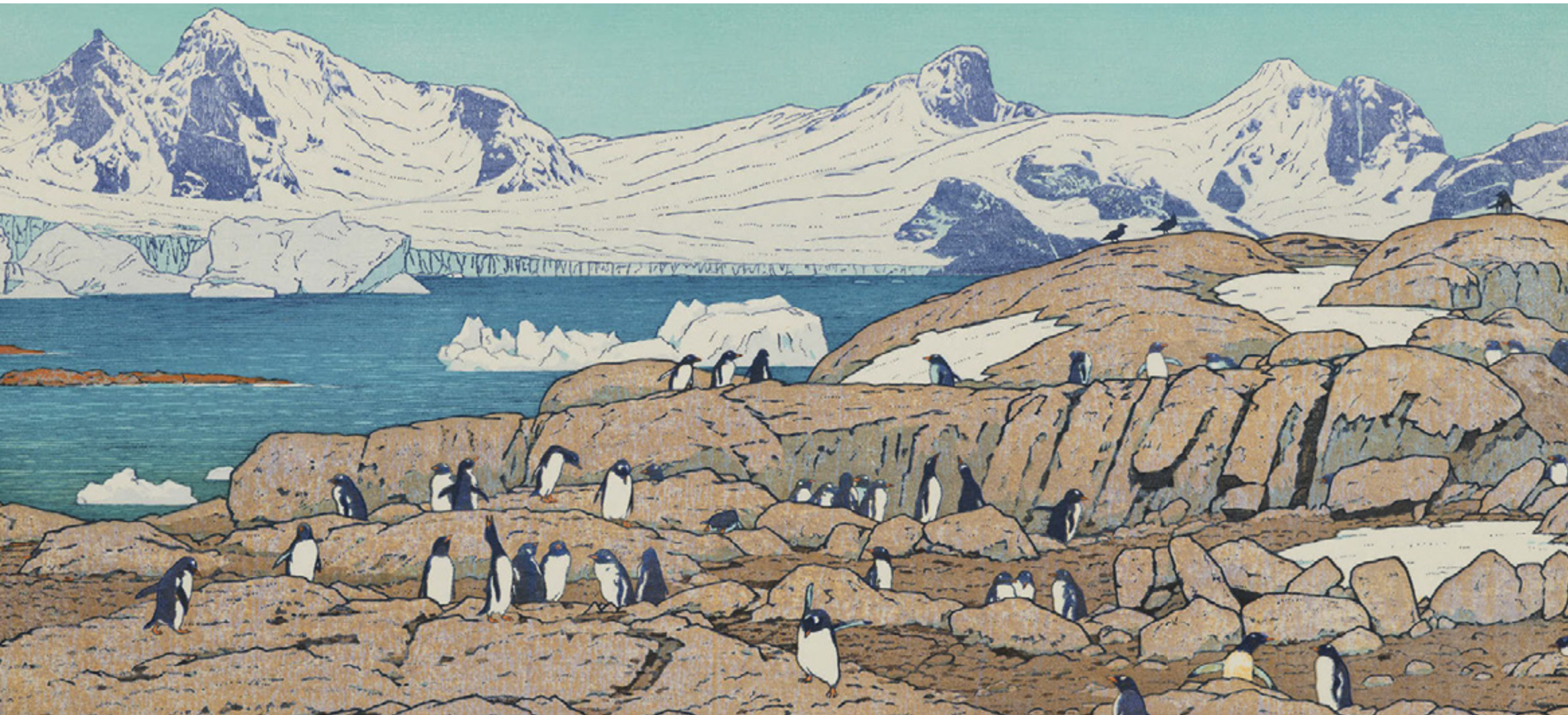
【当見開きページ】 1972年以降、吉田遠志は、旅先で目にした野生動物を題材とした自然主義的な版画制作へと傾倒していった。(左上) 1977年の作品「ゼントウペンギン」は、彼の南極訪問の経験をもとに制作。(下)「トムソンガゼル」(1972年制作)では、ふたつの版で平行線を重ねることで疾走感を出している。(右上) 1987年の作品「黒ひょう」からは「静寂」と「緊張力」が感じられる。このふたつの要素は、遠志の作品にしばしば見られる特性であると、吉田家について研究していた学者のユージン・スキップは述べている。