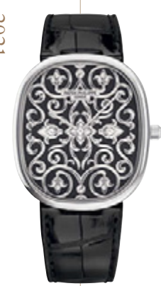
2021 5738/51G-001モデル ゴールド・エリプス 2015年のカラトラバ(上)と同様、この時計はクラシックなゴールド・エリプスに希少なハンドクラフトを導入した現行コレクション初のモデルであった。シャンルヴェ本七宝と手彫金を施した34.5mm x 39.5mmの5738/51Gモデルはゴールド・エリプス・ファミリーを刷新した(詳細は右上および32~37ページ参照)。