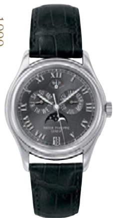
1999 5056P-001モデル 年次カレンダー 直径36.5mmの5056Pモデルは、2つのデザイン上の特徴で注目される。ひとつはアントラサイト文字盤であり、これが同コレクションにおける、よりモダンなスタイルのカラー文字盤の出発点となった。もうひとつは、ケース側面にダイヤモンドをセッティングした初のブラチナ・ウォッチだったことであり、これが現行コレクションのブラチナ・モデルの特徴となった。