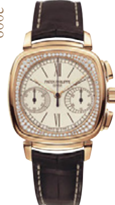
2009 7071R-001モデル レディス・ファースト・クロノグラフ 35mm x 39mmのレディス・ファースト・クロノグラフは、サファイヤクリスタル・バックを通して鑑賞できるパテックフィリップ初の完全自社開発・製造手巻クロノグラフ・ムーブメントを搭載したことなど、多くの点で先駆的であった(前ページ右下)。サファイヤクリスタルの下に配置されたダイヤモンドの装飾もオリジナルである。