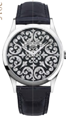
2015 5088/100P-001モデル 渦巻と唐草模様の文字盤を備えたカラトラバ この直径38mmの5088/100Pモデルは、手彫金とシャンルヴェ本七宝という希少なハンドクラフト技術を現行コレクションに導入して制作された、見事なイブニング・ウォッチである。このアプローチは、長年にわたり他のクラシック・モデルにも応用された。下はその一例である。