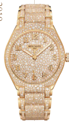
2019 7300/1450R-001モデル Twenty-4オートマチック・ハイジュエリー 直径36mmのラウンド型Twenty-4オートマチックのハイジュエリー・バージョンは、上のモデルを元祖とするウォッチ・コレクションを記念して制作された。プレスレット、リュウス、ベゼル、文字盤は全面にダイヤモンドがスノー・セッティング(ランダム・セッティング)され、きわめて豪華な効果を生み出している。