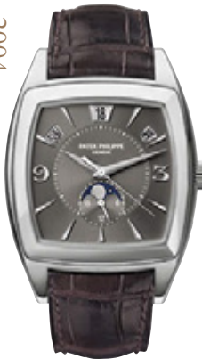
2004 5135G-010モデル ゴンドーロ・カレンダー 本モデル(38mm x 51mm)が2004年、最初のコンプリケーション・ウォッチとして加わるまで、ゴンドーロは10年以上にわたり時刻表示のみの時計から構成されてきた。年次カレンダー機構は、1996年に発表されて以来、ラウンド型のモデルにのみ搭載されてきたが、5135モデルは初めてコンプリケーション機能にアール・デコ・デザインを組み合わせた。